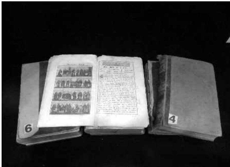
Четвы-миней на церковно-славянском языке