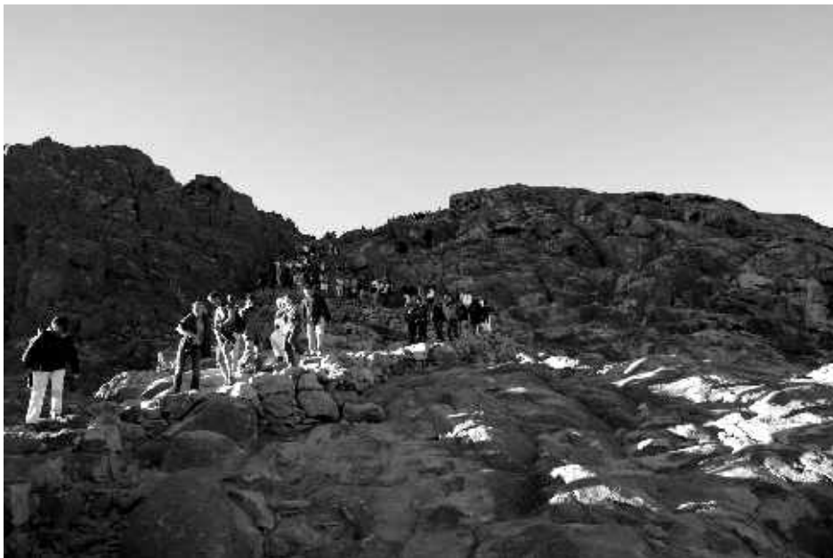
Спуск с горы Моисея

рассвета оставалось совсем немного времени, небо стало сереть, а звезды становились всё тусклее, и так хотелось впитать эту красоту, чтобы уже не забыть никогда. Стало совсем светло, но солнце ещё не появлялось, взгляды всех людей были устремлены в одно место, и вот из-за небольшого облачка (дымки) стало появляться солнышко. Это был пик ликования души, когда ты видишь восход солнца на уровне твоих глаз, и не нужно заирать голову, чтобы его увидеть. Было такое впечатление, что солнце цвета раскаленного золота. К сожалению, восход длился всего несколько минут, но как только солнце поднялось, ветер сразу стих и стало теплеть. Согласно легенде, поднявшись на гору Моисея и встретившим там рассвет Господь отпускает все грехи. Не знаю, что это было, но во время восхода возникли неопишутые