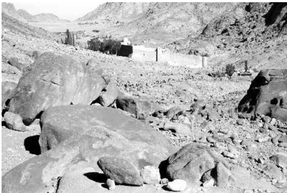
Вид на монастырь святой Екатерины

Около часа ночи автобус подъехал к монастырю святой Екатерины, где нас встречал гид-бедуин, который проинструктировал, как себя вести и что ожидает нас в пути длиной 6,5 километра в одну