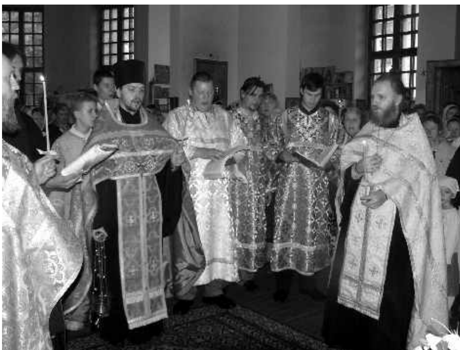
Праздник Успения Пресвятой Богородицы

А вы заметьте, что древние христиане молились не в золоте и благолепии, а при слабом свете лампад, в убогих стенах, без такого количества икон, и как высока была их молитва. Как радовались они пред Богом. Дай, Боже, и нам хоть немного приблизиться к их совершенству. Всегда радостно видеть среди молящихся у нас прихожан Никольского храма, знакомые лица. Во все наши храмовые праздники вы посещаете нас, молитвенно поддерживаете, делите радость праздника. В этом году в день престольного праздника, шестого октября, наш храм будет отмечать пятилетие начала служения Божественной литургии. Надеюсь, что по заведенной традиции мы вновь сможем вместе, единым сердцем прославить Бога, поблагодарить Его за дарованную милость и испросить благословения на предстоящие труды. Вместе прославим святителя Иннокентия, который в сонме святых нашего храма ходатайствует о нас, наставляет на путь спасения, помогает непорочно хранить нашу Святую веру.