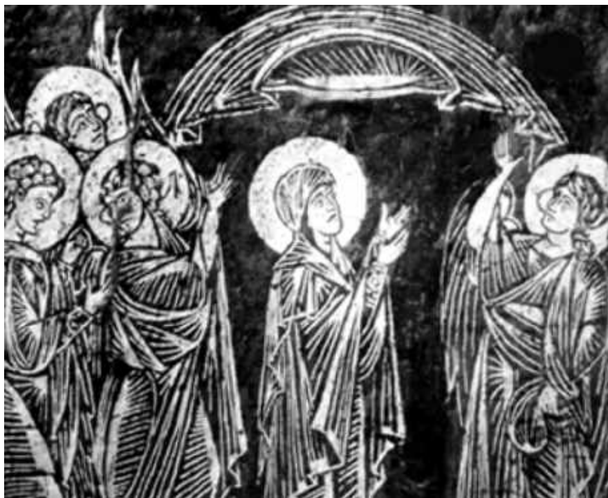
Древнейшее изображение иконы праздника «Покрова Пресвятой Богородицы»

В Новгороде было принято изображать храм, как бы в разрезе. Под его сводами предстала Богородица, молящаяся с воздетыми руками и стоящая на облаке. Над Нею Ангелы держат распростертый покров. В нижней части новгородских икон изображаются закрытые Царские врата, справа от которых стоит Андрей юродивый, указывающий рукой своему ученику Епифанию на это чудо. Ранний суздальский извод икон Покрова очень существенно отличается по содержанию от новгородского. Самое главное, что в центре суздальской иконы под Богородицей, молящейся на воздухе за людей, на церковном амвоне стоит юноша, держащий хартию. На некоторых иконах тексты хартий сохранились. К нашему изумлению мы можем