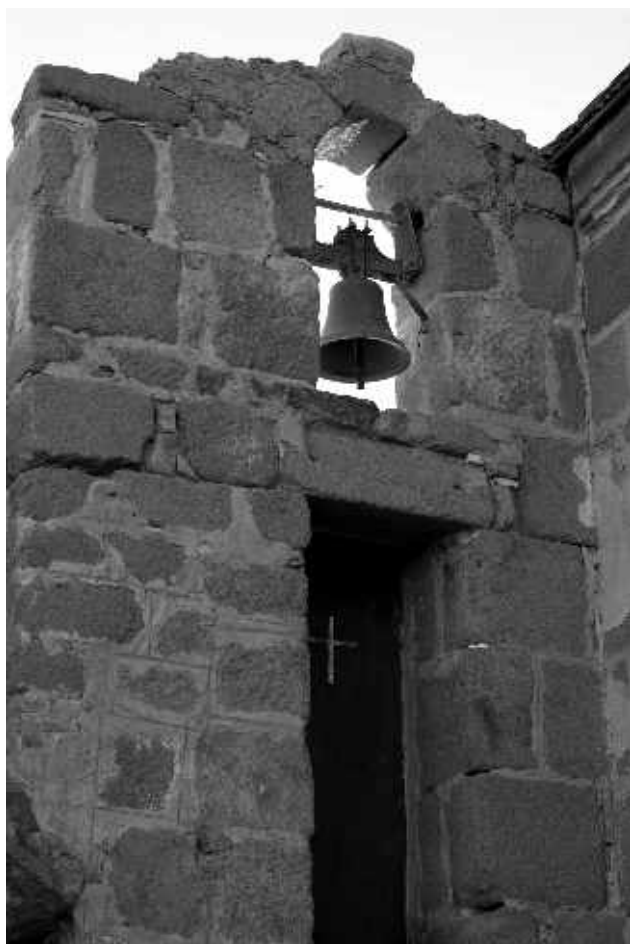
Храм Святой Троицы

В следующей нашей статье мы расскажем про монастырь святой Екатерины.