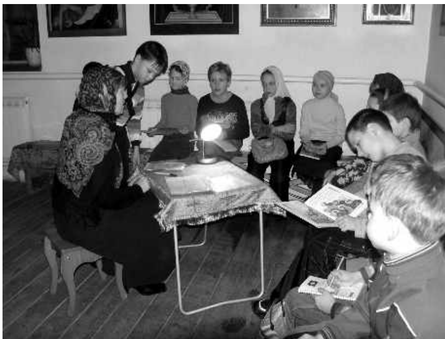
Первые занятия Воскресной школы

Помнится мне, как проходили первые занятия в нашей Воскресной школе. Прямо в храме между богослужениями дети расставляли стульчики, брали тетрадки и, держа их на коленях, записывали уроки преподавателей. Родители ждали их в сторожке. Кто-то молился у иконы, кто-то прогуливался вокруг храма, и был только один класс маленьких учеников. Сегодня же наша Воскресная школа располагается в хорошо отделанных классах с современным учебным оборудованием, с красивыми портретами и мебелью, почти как в средней московской школе. Различные церковные и культурные предметы детям преподают педагоги с высшим образованием, любящие детей и свое дело. Занятия теперь организованы так, что часть их проводится во время богослужения, и родители в это время могут помолиться в храме. Несколько раз в год наши дети готовят концерты, театральные постановки, устраивают праздники, и