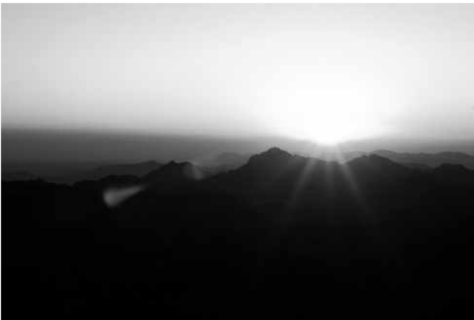
Рассвет на горе Моисея

запахи. Главное, вовремя уворачиваться от пробегающих мимо верблюдов и бедуинов с криками «Кэмел». Через каждые два километра были остановки для отдыха, где можно было посидеть и попить воды или чая, но если вошел в ритм, то лучше не останавливаться, потом очень сложно набрать прежнюю скорость. Последний отрезок пути был самым сложным, около 700 ступеней, местами ширина ступеней была 1,5 метра, а высота около 30–40 сантиметров. Только молитва помогала не возроптать. У подножия горы температура воздуха была около +27 °С, чем выше мы поднимались, тем холоднее становилось, а на самой вершине температура упала до +7 °С. И вот последнее препятствие, с Божьей помощью, преодолено, и мы оказались на самом пике горы. Но на этом наши испытания не закончились, на вершине дул леденящий и пронизывающий ветер, укрыться от него было невозможно. Забывая о гигиене, мы были вынуждены взять у бедуинов напрокат очень грязные пледы, чтобы как-то спастись от ветра и не отвлекать свои мысли от цели нашего восхождения. До