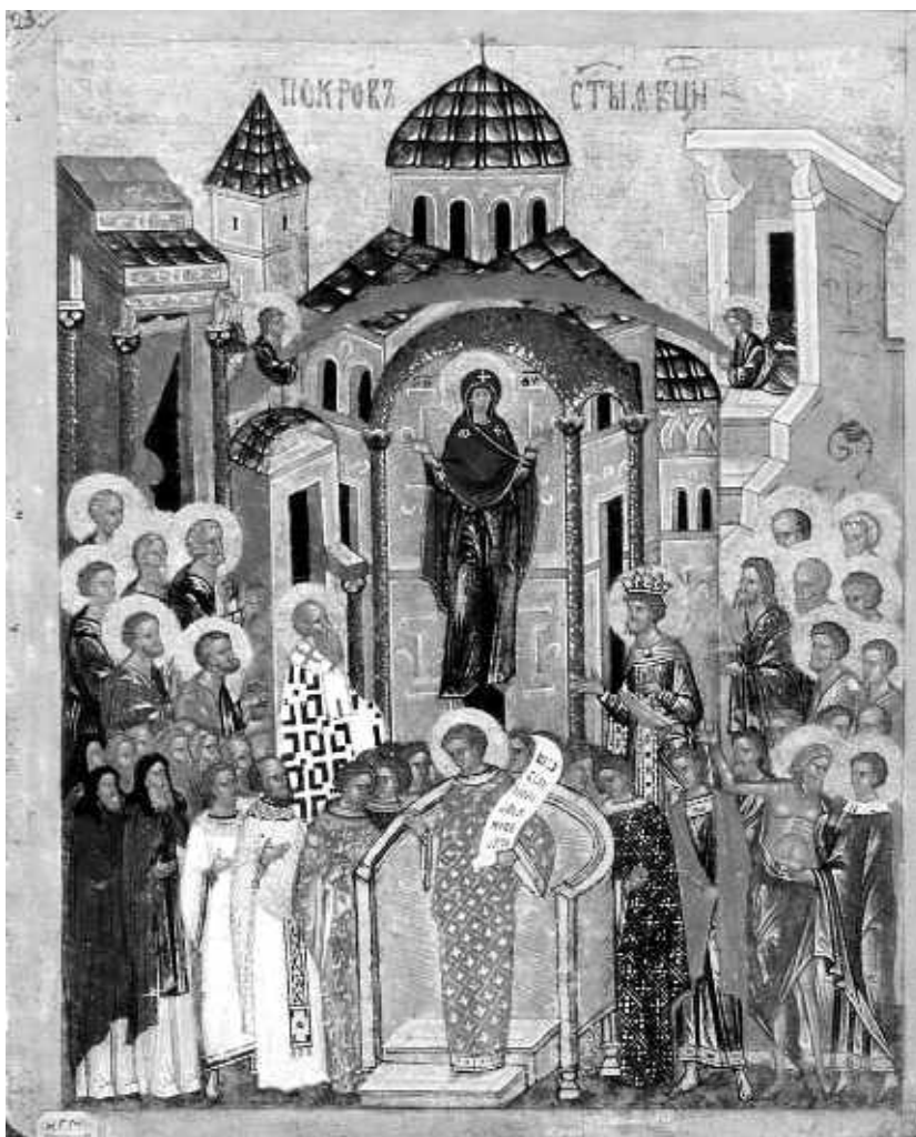
Икона «Покрова Пресвятой Богородицы». Конец XV – начало XVI вв.

Покров, который Она простерла над людьми, по-гречески называется омофор. Это широкая лента, которую мы